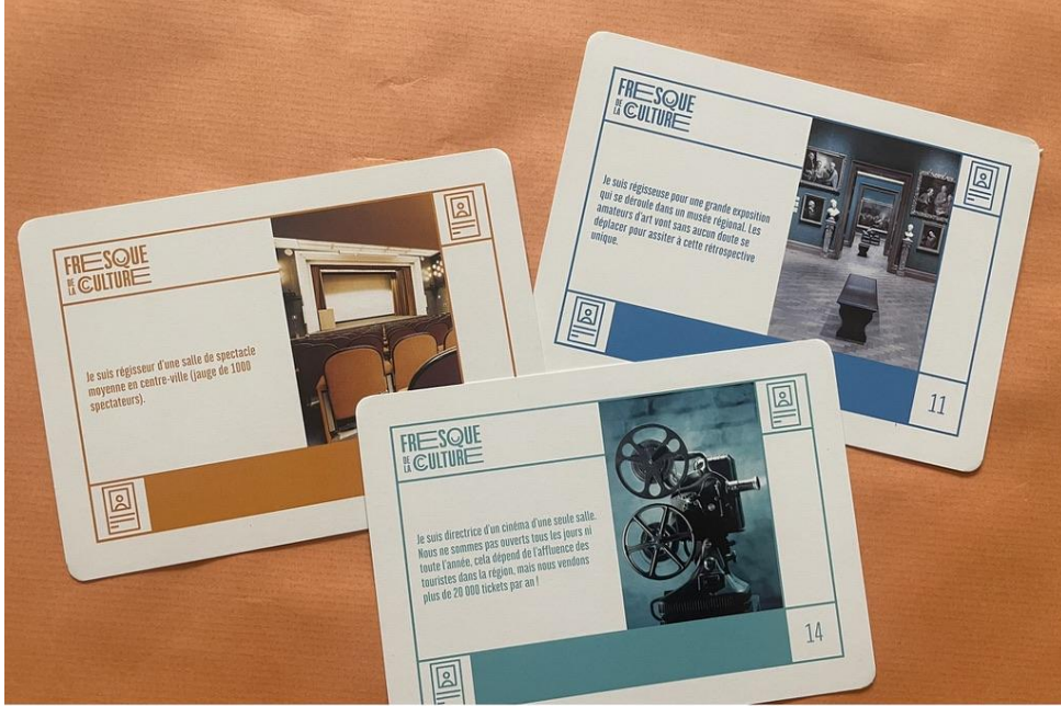
8 profils métiers du spectacle vivant, des arts visuels, du cinéma ou du livre