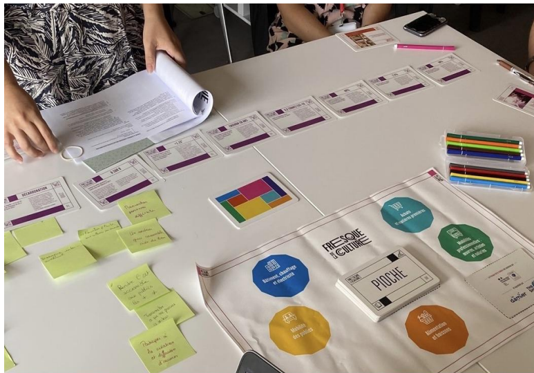
Découverte des postes d'émission du secteur culturel