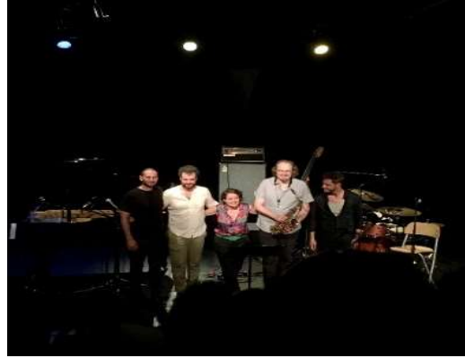
Concert de clôture 18 juin 2022 - Taverny