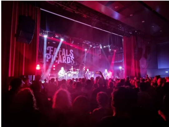
Soirée d'ouverture 1er avril 2022 – La Luciole - Méry-Sur-Oise