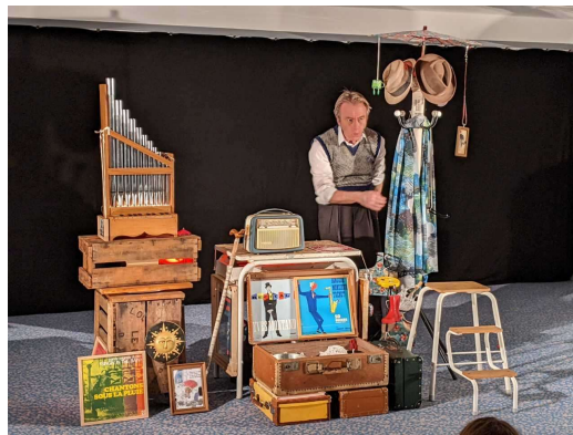
16 avril 2022 – Cormeilles-en-Parisis